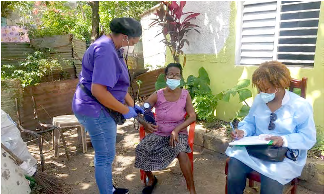
Dos miembros del equipo médico con un vecino del pueblo. | Two members of the medical team with a village resident.