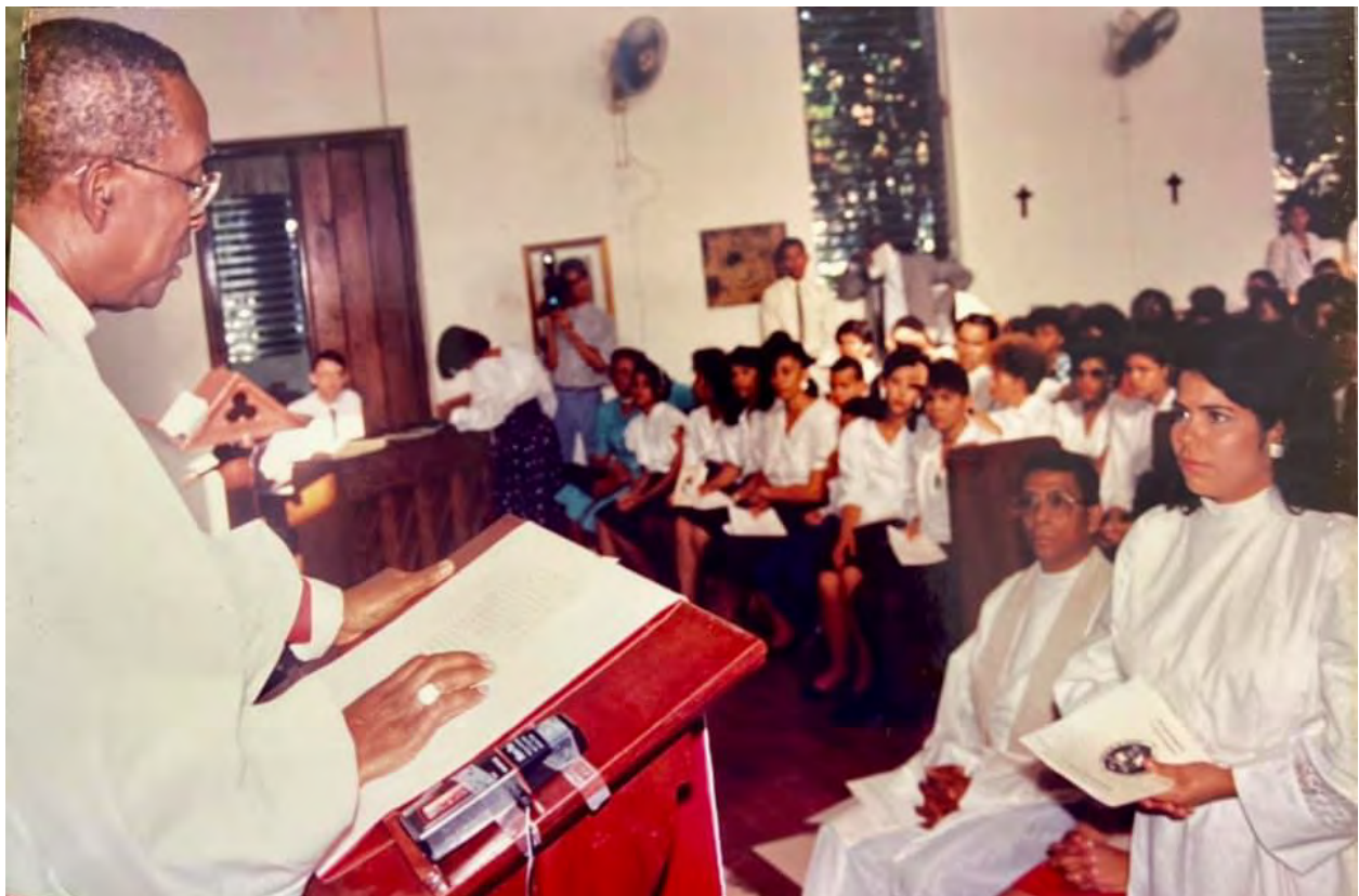
Una fotografía de la ordenación del 10 de marzo de 1991. | A photograph from the ordination on March 10, 1991