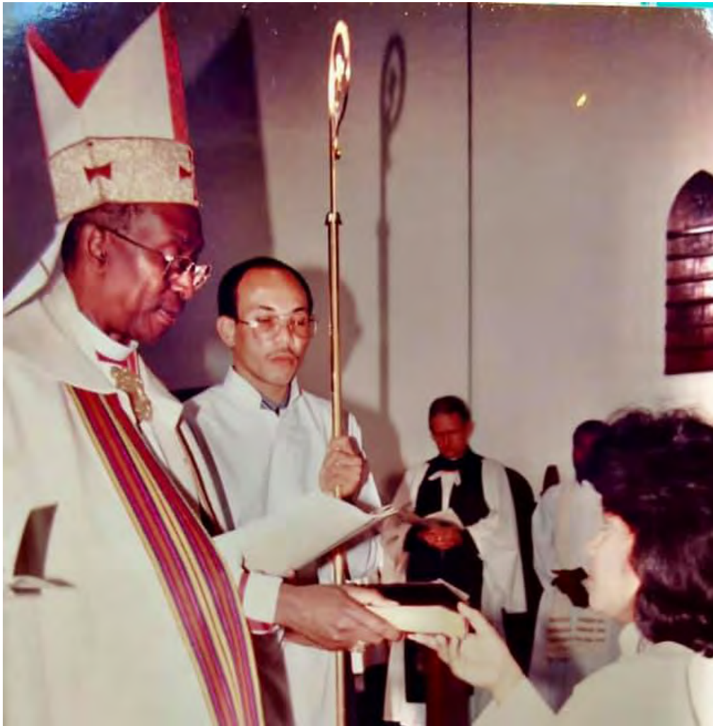
Una fotografía de la ordenación del 10 de marzo de 1991.