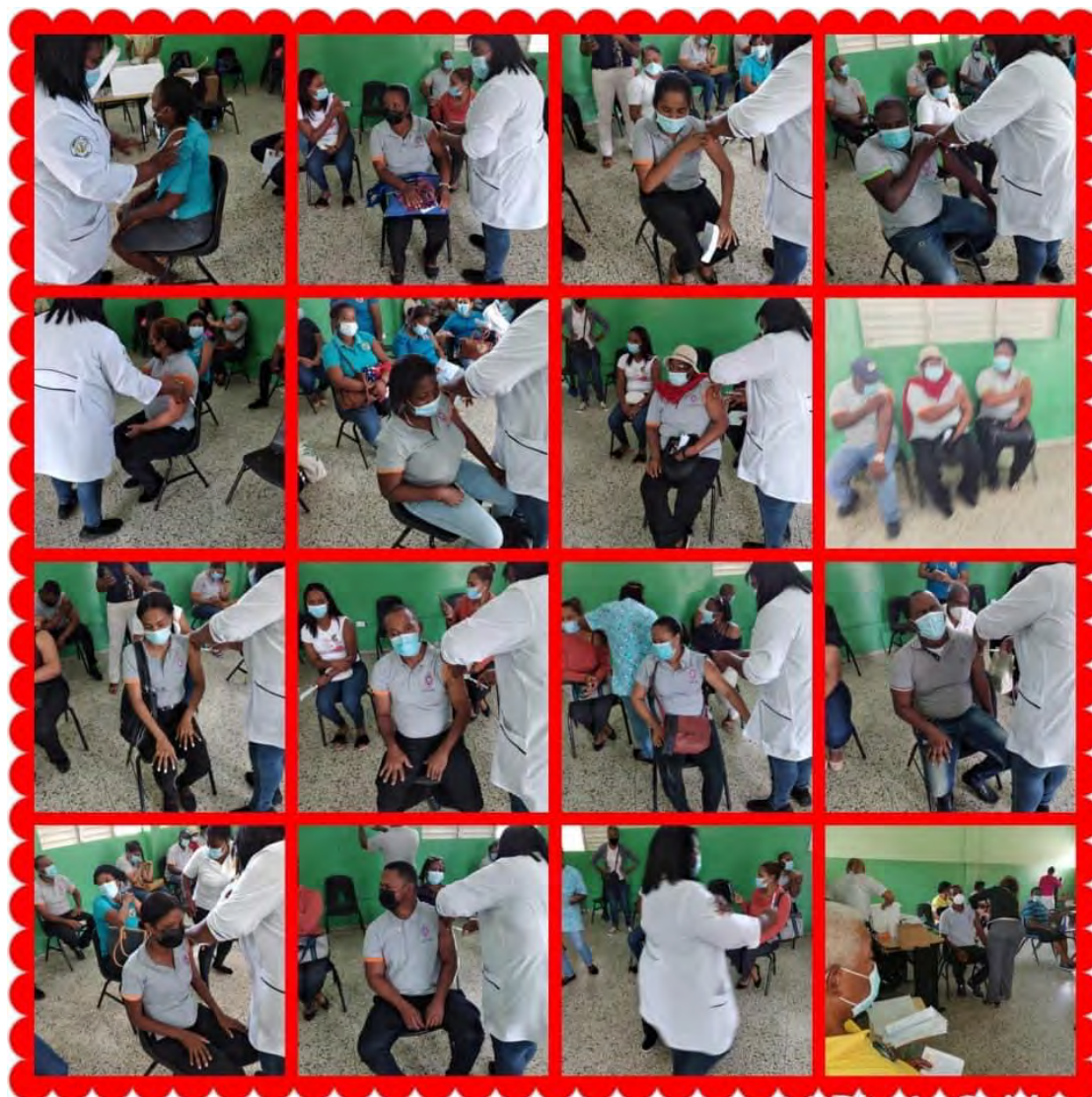
Vacunación del profesorado y personal del Colegio Episcopal San José en Boca Chica | Vaccination of the faculty and staff of Colegio Episcopal San José in Boca Chica

vaccinated. In phase I-C teachers, police and military will be vaccinated. Following the phases dividing by age group and comorbidities.