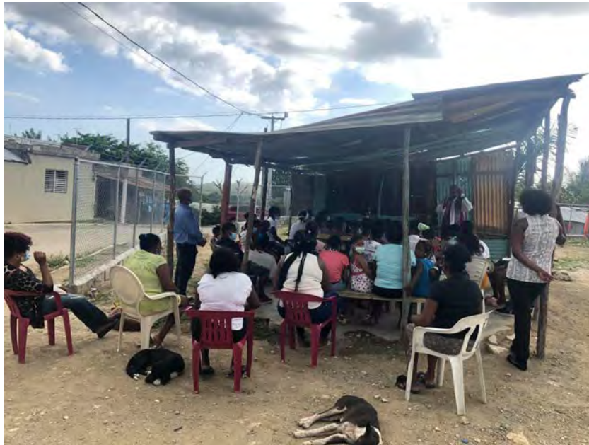
Celebración de la Santa Eucaristía en el albergue temporal de Catalina el 27 de marzo de 2021 | The celebration of the Holy Eucharist in a temporary shelter in Catalina on March 27, 2021.