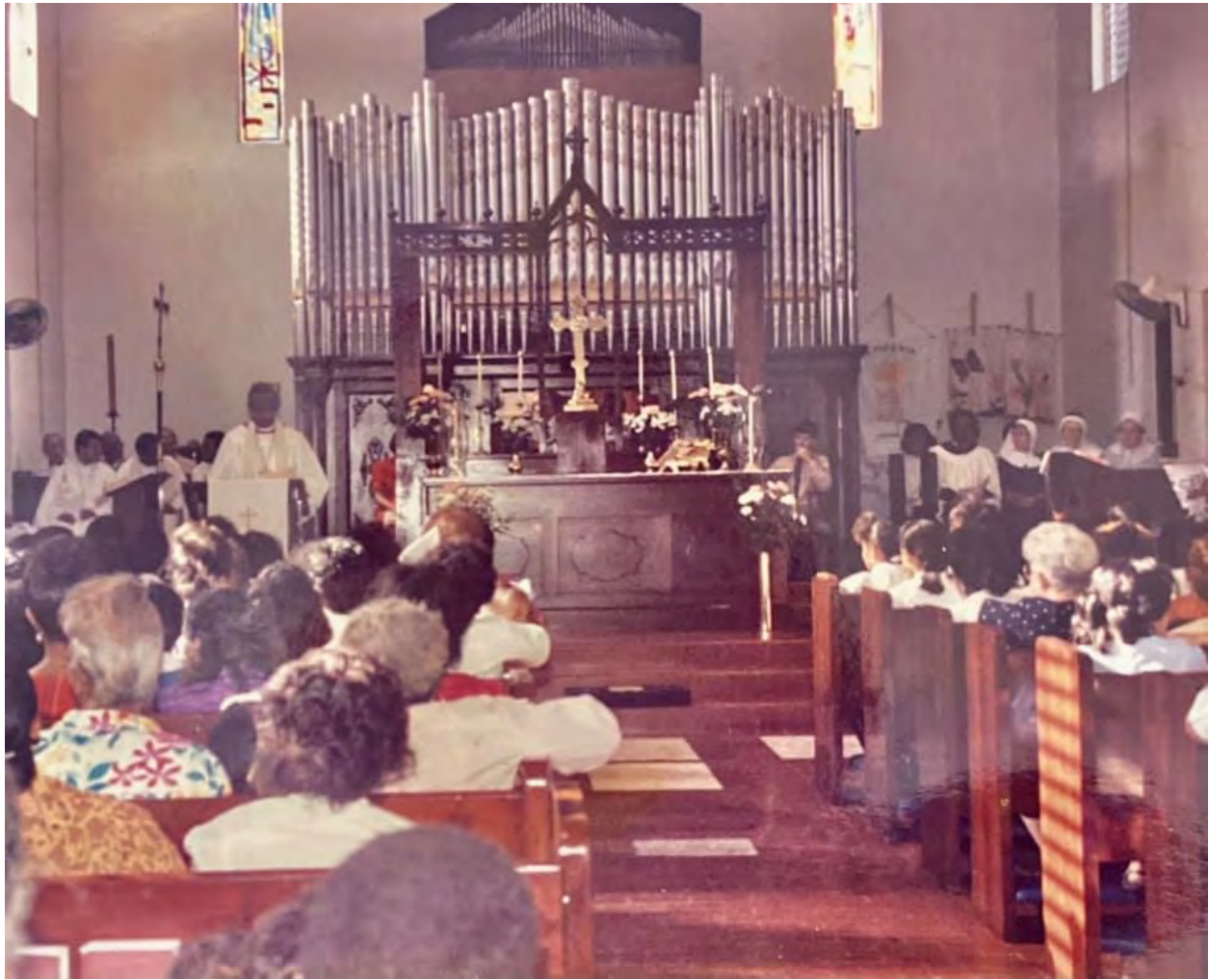
Una fotografía de la ordenación del 10 de marzo de 1991. | A photograph from the ordination on March 10, 1991

our diocese, so she decided to go to Panama where she was ordained. Her fidelity to her calling was very inspiring.