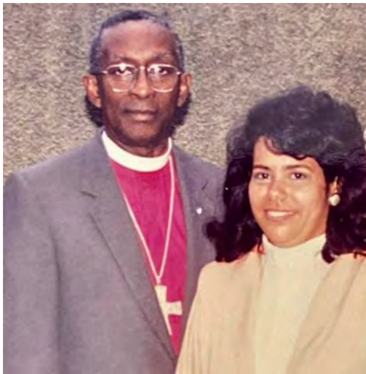
Después de la ordenación el 10 de marzo de 1991. | After the ordination on March 10, 1991

It was difficult in the beginning because I came from a family where it was compulsory to do a university degree and I had to leave my call aside. I graduated as an Architect at the Autonomous University of Santo Domingo, and later entered the seminary.