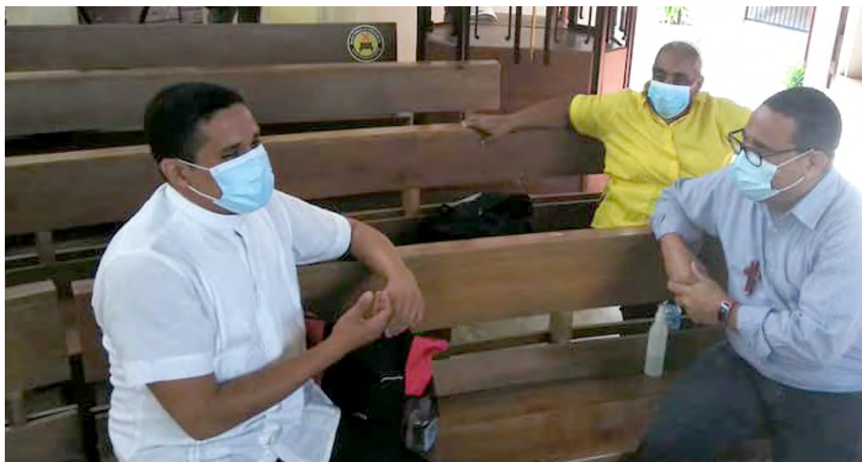
Hablando con miembros de San Andrés / Speaking with members of San Andrés