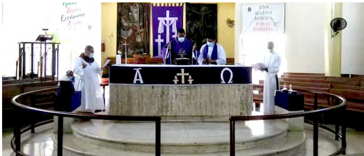
El altar de la Iglesia Episcopal San Andrés | The altar at Iglesia Episcopal San Andrés