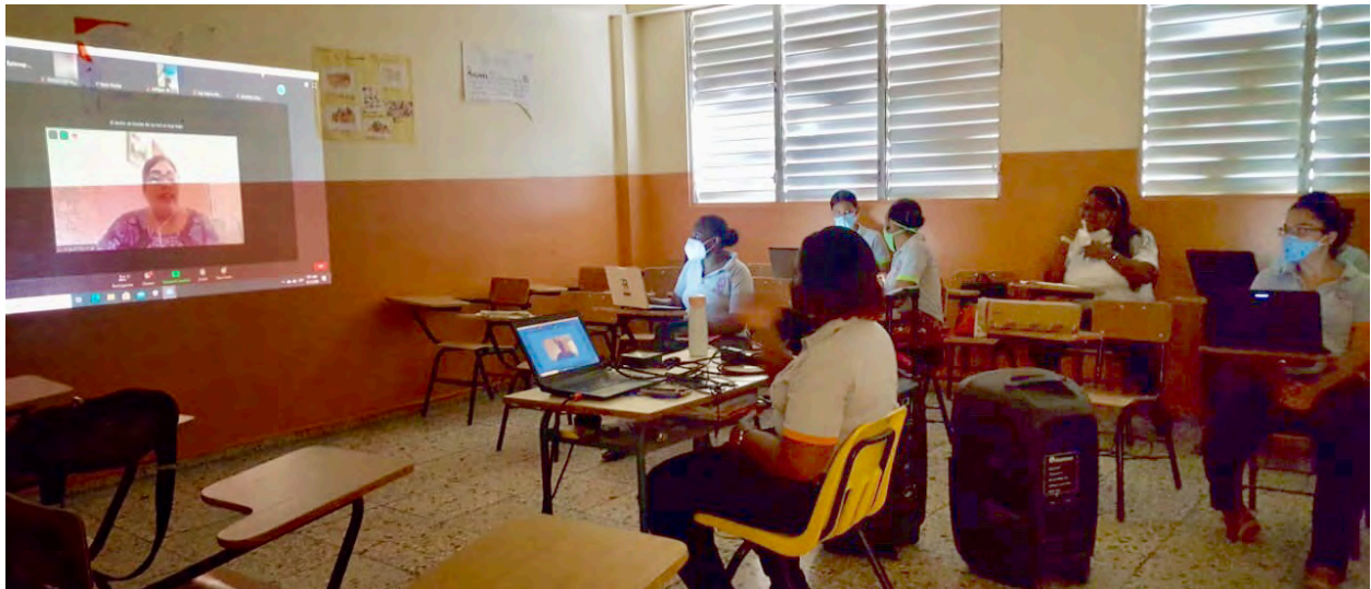
Una sesión de formación docente durante la pandemia | A teacher training session during the pandemic

Por Tom McGowan and Elizabeth Hutchinson