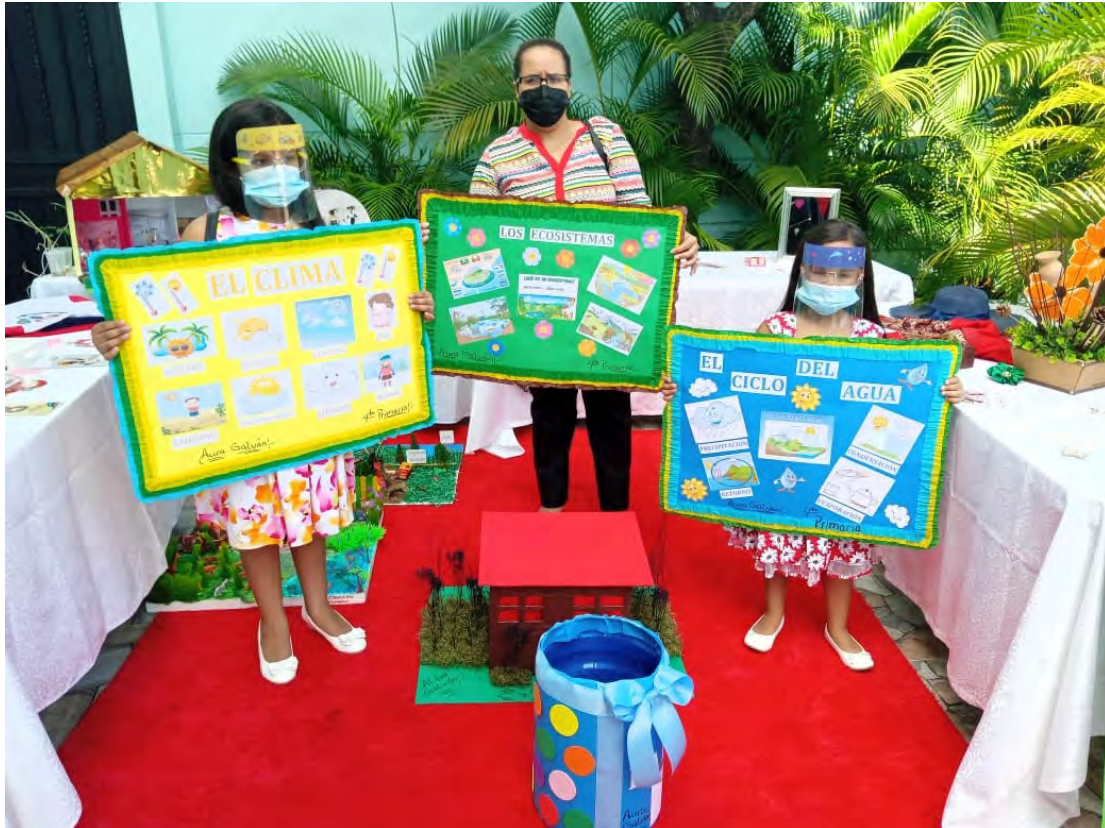
Estudiantes en un programa de ciencias naturales mostrando sus proyectos. | Students in a natural sciences program displaying their projects.