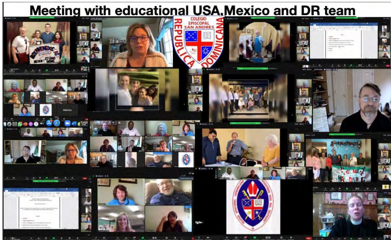
Collages de imágenes de encuentros de Zoom entre educadores de Estados Unidos, México y República Dominicana | Collages of images of Zoom meetings between educators in the United States, Mexico, and the Dominican Republic