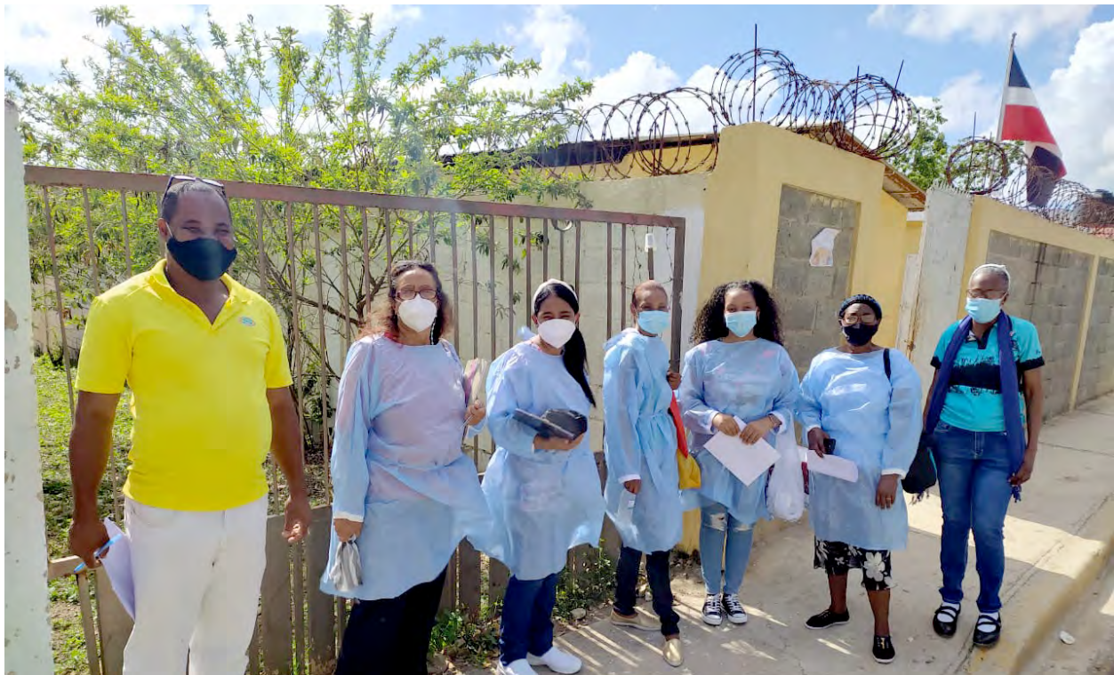
Miembros del equipo médico de Gautier | Members of the medical team in Gautier

This group had been doing this medical operation for over 18 consecutive years where they treated just over 1000 patients from Villa Gautier and neighboring communities in a week-long journey. For this they have used the facilities of the Saint Thomas Episcopal Church.