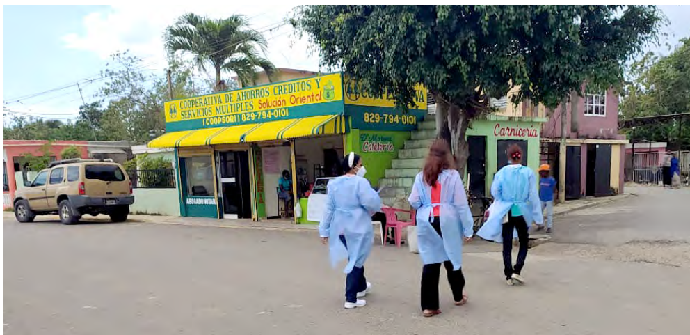
Miembros del equipo médico caminando en Gautier | Members of the medical team walking in Gautier

Since March 26th to 30th, the Dominican Episcopal Church Health Pastoral Commission, with the collaboration of doctors and colleges members of the Church has been conducting this medical operation. In the same they check blood pressure as well as sugar level for diabetes patients in the Villa Gautier community and surrounding areas. This is being done with around 100 patients who each year the St Church Medical Group. Eustace, in Lake Placid, NY, provide a full examination and provides them with the medications for a year.