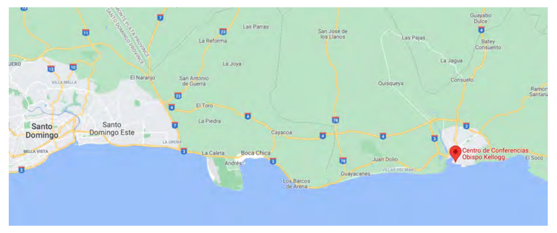
La ubicación del Centro Kellogg | The location of the Kellogg Center

Comida preparada en el Centro Kellogg Food prepared at the Kellogg Center