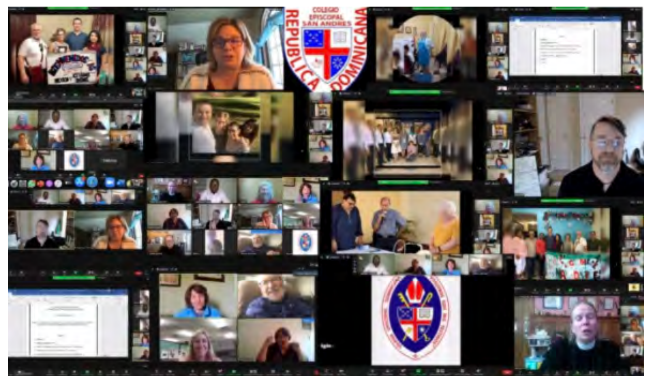
Taller de Zoom con educadores en República Dominicana, México y Estados Unidos A workshop on Zoom with educators in the Dominican Republic, Mexico and the United States

When I first visited the DR, I found 26 colegios across the country, united in mission and faith, but for the most part working alone. Each school operated independently under the direction of a parish priest. Many performed admirably. Some struggled with difficult circumstances and did not. Increasingly, though, the Diocesan schools have become an organized "educational system." Hallelujah!