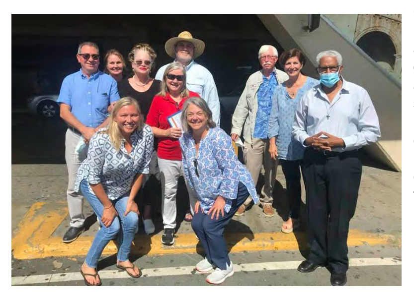
El equipo llegó al aeropuerto de Santo Domingo | The team arrived at the Santo Domingo airport

Con gran alegría, la Iglesia Episcopal Dominicana recibe al grupo Holl Medical, primer grupo en más de un año, en arribar a nuestra Diócesis para servir ofreciendo consultas médicas gratuitas, en la comunidad de Angelina, San Pedro de Macorís, comunidad con la que este equipo médico tiene una hermosa relación de muchos años. Les damos la más cordial bienvenida.