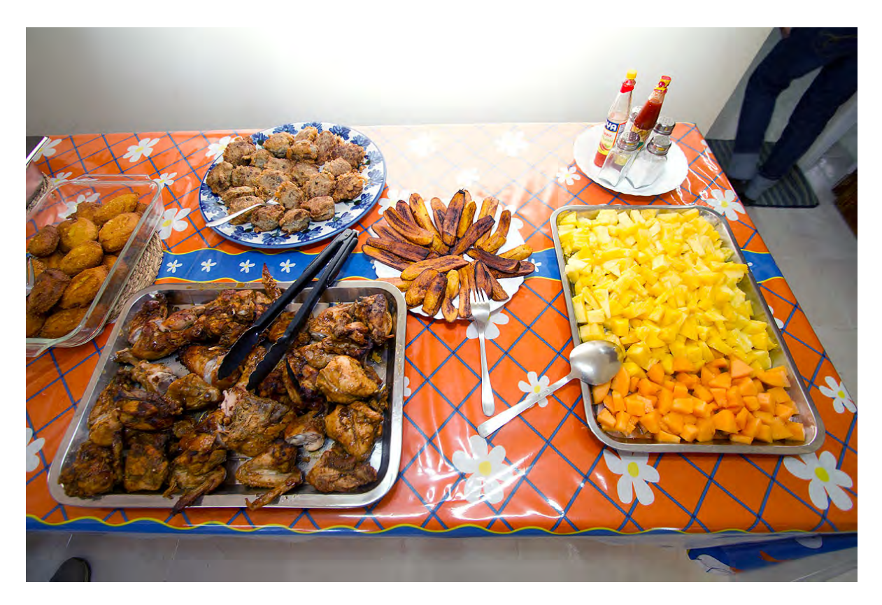
En el centro, con tenedor: Plátanos en el Centro Kellogg In the center, with fork: Plaintains at the Kellogg Center

Maestro jubilado y líder del equipo misionero, St. Catherine's School en Richmond, VA Retired teacher and mission team leader, St. Catherine's School in Richmond, VA