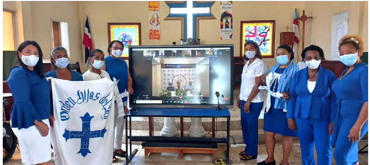
Participando en línea desde Boca Chica | Participating online from Boca Chica

The fifteenth assembly of the Order of the Daughters of the King of the Dominican Diocesis took place Saturday, October 16, 2021. It was transmitted virtually, via Zoom, from the Diocesan Center, and it was hosted by the church of San Felipe Apóstol. The event, transmitted live on Facebook, started at 8:45 a.m. with a Holy Eucharist celebrated in the San Juan Evangelista y Apóstol Chapel of the Diocesan Center and the admission of two new members of the Daughters of the King. The activities were shared on the screens of the platform with the participation of the Right Reverend Moisés Quezada, the National Chaplain the Rev. Diego Sabogal, members of the board, 44 Daughters of the King serving as delegates from the participating chapters, many guests, and the rest of the Daughters of the King who gathered and participated in groups via a screen in the platform. We had an emotional welcome and a space to remember the history of the Order in the nation. We remembered the Daughters of the King who had already died and are in the presence of God, welcomed 19 new Daughters of the King, and received a video with a greeting from Canon Virginia Norman, the first president of the Order in the nation. During the event, we had a reflective time led by Eimy Ramírez from the Santa Cruz Chapter. The president, secretary, and all participating chapters presented their reports. It was a time of joy, fraternal love and unity. IHS.