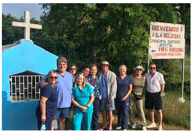
Fotografía de grupo del equipo camino a Angelina | The team's group photograph on the road to Angelina

A complete report of the history of this mission team, updated to include the October 2021 trip, is available online here in English: <u>http://iglepidom.org/wp-</u> <u>content/uploads/2021/10/Angelina-2021-</u> <u>Clinic-original.pdf</u>