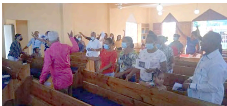
Divina Providencia, Guerra