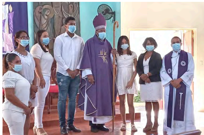
San Andrés, Santo Domingo