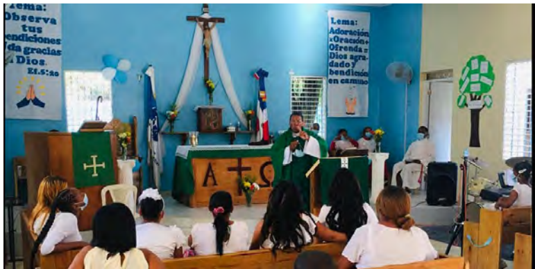
Buen Pastor, San Pedro de Macorís