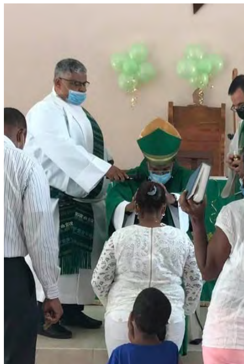
Jesús Nazareno, Santiago