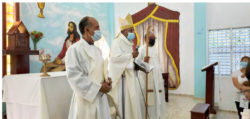
Santa Maria Llena de Gracia, Mao