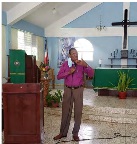
Obispo Moisés Quezada Mota

La Iglesia Episcopal Dominicana continúa dando pasos hacia el fortalecimiento y crecimiento espiritual y ministerial de sus miembros. El sábado 6 de noviembre se instaló oficialmente el Centro de Formación Pastoral y Misionera del arcedianato Sureste, con el objetivo de formar agentes de evangelización que presenten a Jesucristo como Señor y Salvador en diferentes escenarios. La ceremonia celebrada en la Iglesia San Matías de la comunidad de Santana, Baní, contó con la presencia del Obispo Diocesano Rvdmo. Moisés Quezada Mota y de todo el clero de la región, así como de miembros de las diferentes congregaciones que conforman el arcedianato. Este es un esfuerzo por tener una iglesia viva, que de testimonio de Cristo Jesús y que pueda responder a las necesidades de la sociedad moderna.