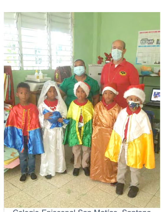
Colegio Episcopal San Matías, Santana Baní