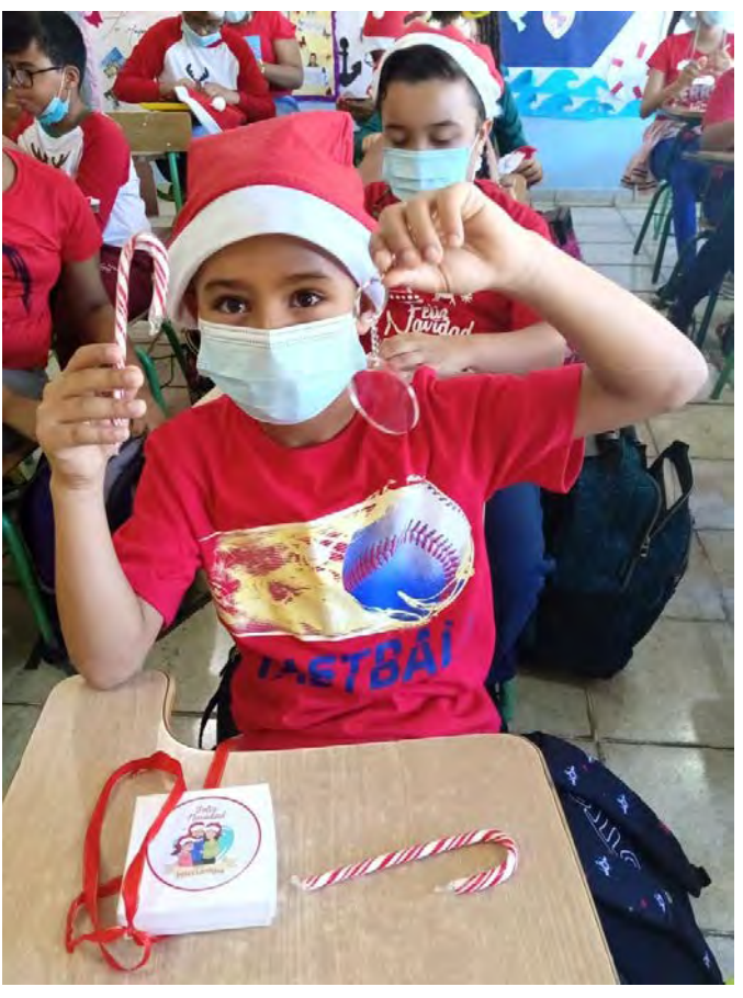
Colegio Episcopal San Andrés, Santo Domingo