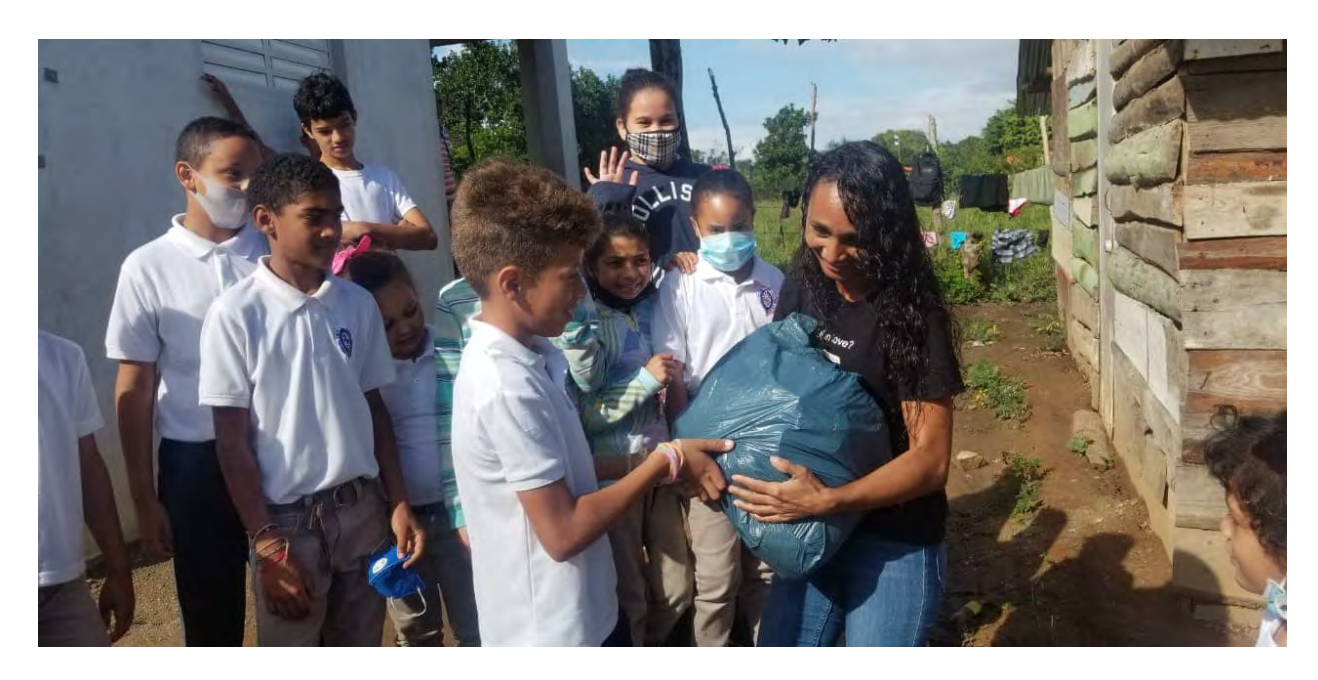
Colegio Episcopal Monte de la Transfiguración, Jarabacoa: Entregando regalos de comida | Delivering gifts of food