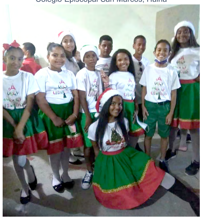
Colegio Episcopal La Encarnación, La Romana