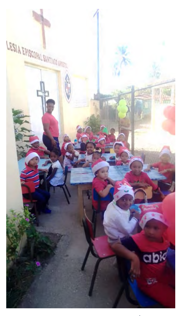
Colegio Episcopal Santiago Apóstol, Ángelina