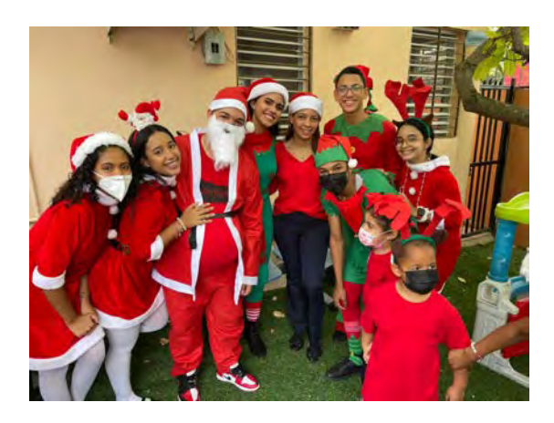
Colegio Episcopal La Anunciación, Santiago