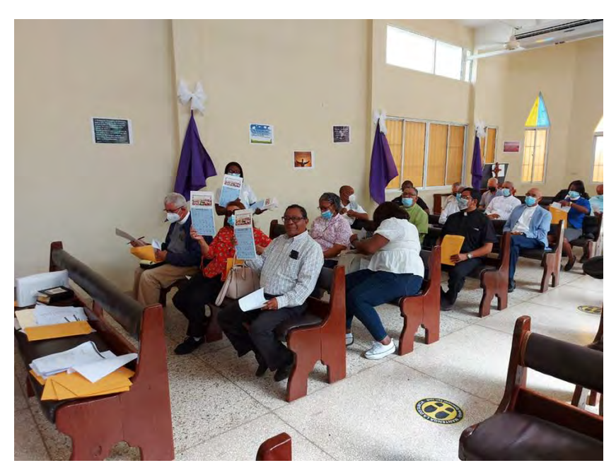
El clero recibió los calendarios diocesanos para 2022.

Iglesia Episcopal San José en Boca Chica