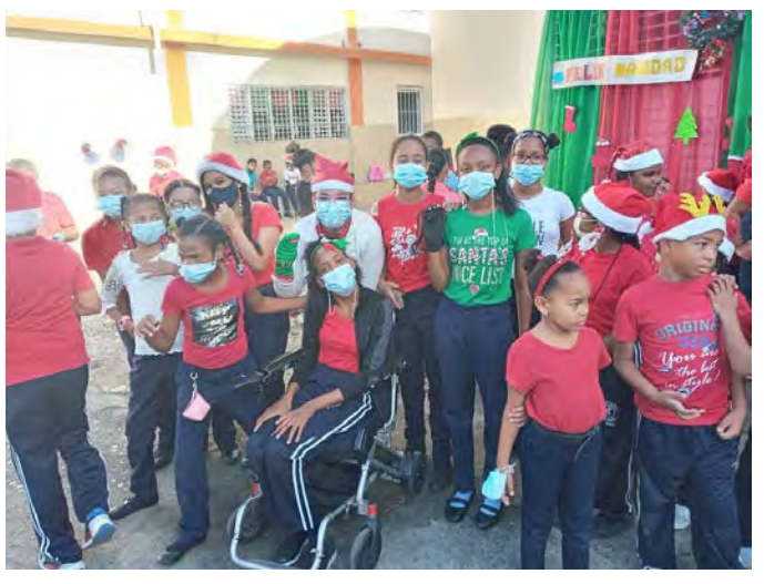
Colegio Episcopal San Marcos, Haina