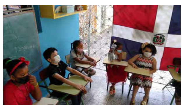
Colegio Episcopal Santísima Trinidad, Santo Domingo