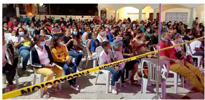
Colegio Episcopal La Encarnación, La Romana