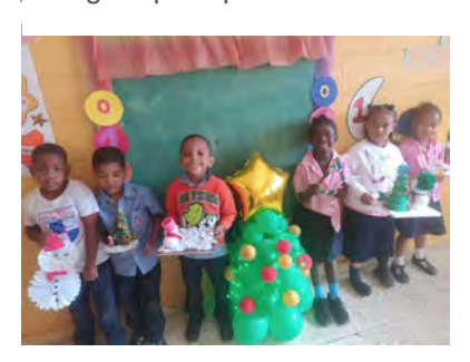
Colegio Episcopal Santa Cruz, San Pedro de Macorís