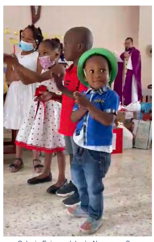
Colegio Episcopal Jesús Nazareno, San Francisco de Macorís