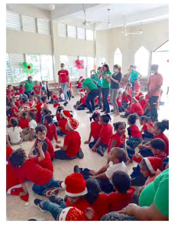
Colegio Episcopal La Transfiguración, Baní