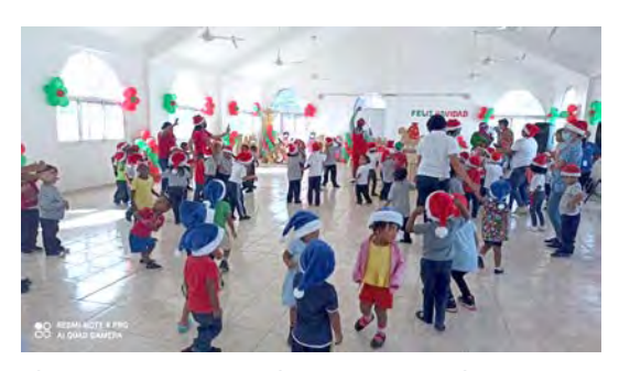
Colegio Episcopal San Esteban, San Pedro de Macorís