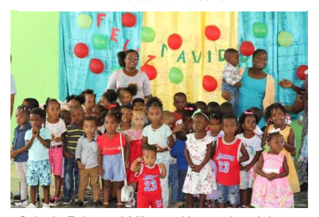
Colegio Episcopal Milagros Hernandez, Jalonga