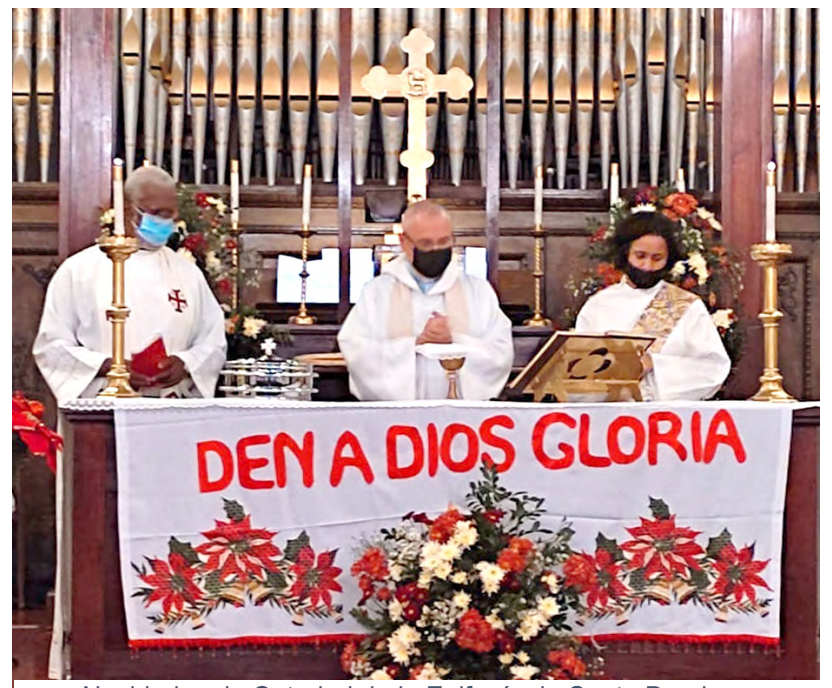
Navidad en la Catedral de la Epifanía de Santo Domingo

measured, without any kind of debauchery. We must pray for the world, especially for each one of us, for the sick, taking into account those of COVID 19 and their relatives, also the relatives of those who