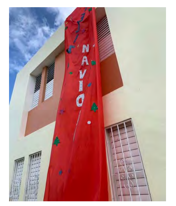
Colegio Episcopal San José, Boca Chica