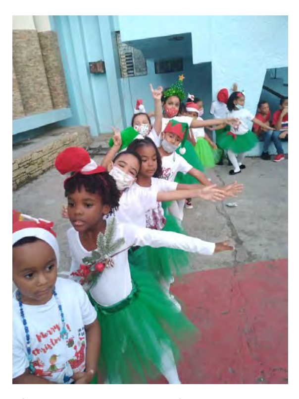
Colegio Episcopal Todos Los Santos, La Romana