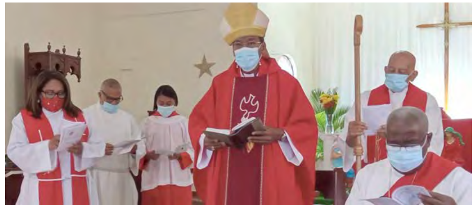
Iglesia Episcopal San Esteban en San Pedro de Macorís