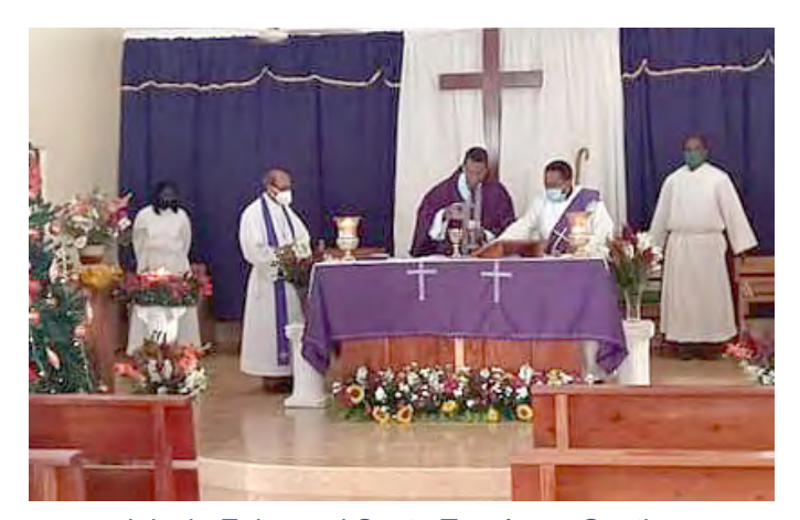
Iglesia Episcopal Santo Tomás en Gautier