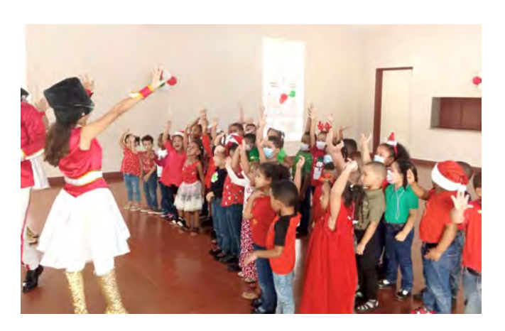
Colegio Episcopal San Andrés, Santo Domingo