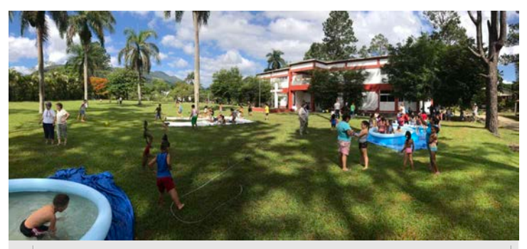
El dormitorio principal y el jardín delantero del Campamento durante una fiesta infantil. |The main dormitory and front lawn of the Campamento during a children's party.

¡Muchas gracias al equipo de One Ball One Village de parte de la comunidad de El Pedregal y del Colegio / Campamento Monte de la Transfiguración! | Many thanks to the team from One Ball One Village from the El Pedregal community and from Colegio / Campamento Monte de la Transfiguración!