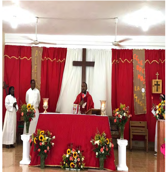
Iglesia Episcopal Santo Tomás Apóstol

normal thing in us, is that if we have experienced something as amazing, as it is being filled with Grace through the Son of God, it is to talk about it, to tell about it, to promote it, to say it, to stand in a corner and shout at the top of our lungs that we have witnessed a wonderful work, we have seen the Messiah!!!