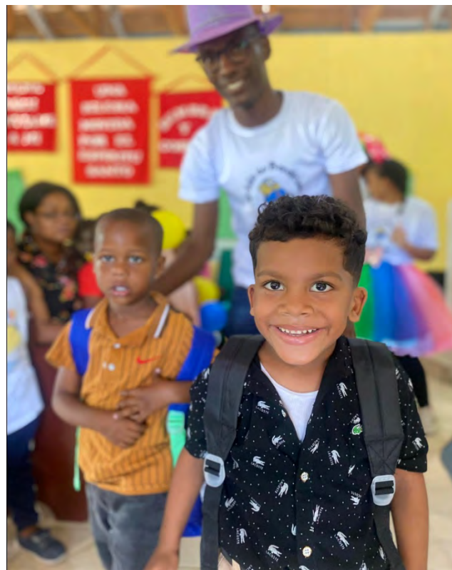
Iglesia Episcopal Santiago Apóstol, La Angelina