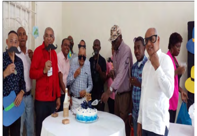
Padres de la Iglesia episcopal Todos los Santos