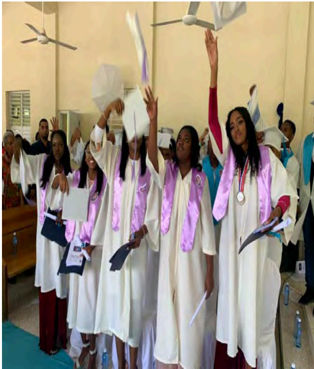
Colegio Episcopal San Andrés, reconocimiento estudiantes meritorios año escolar 2021-2022

En San Andrés, se viven momentos de grandes emociones.