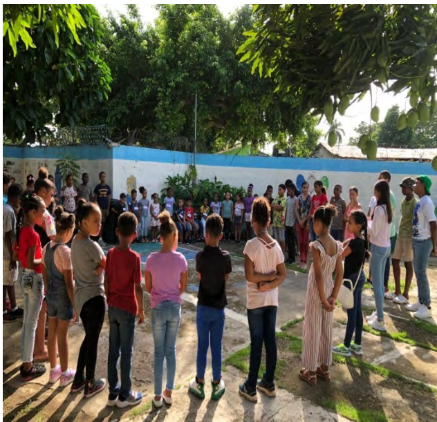
Escuelas Bíblicas de Verano de las Iglesias Episcopales Santa María Virgen, Montellano y Divina Gracia, Mozovi, Puerto Plata.