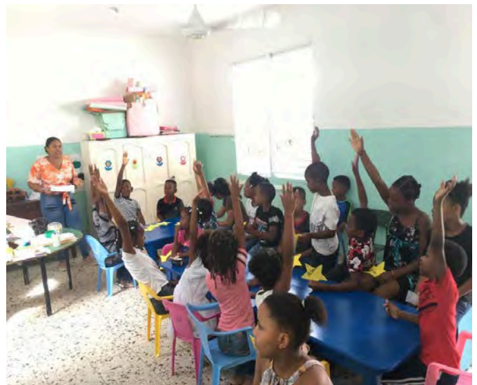
Iglesia Episcopal Buen Pastor, San Pedro de Macorís