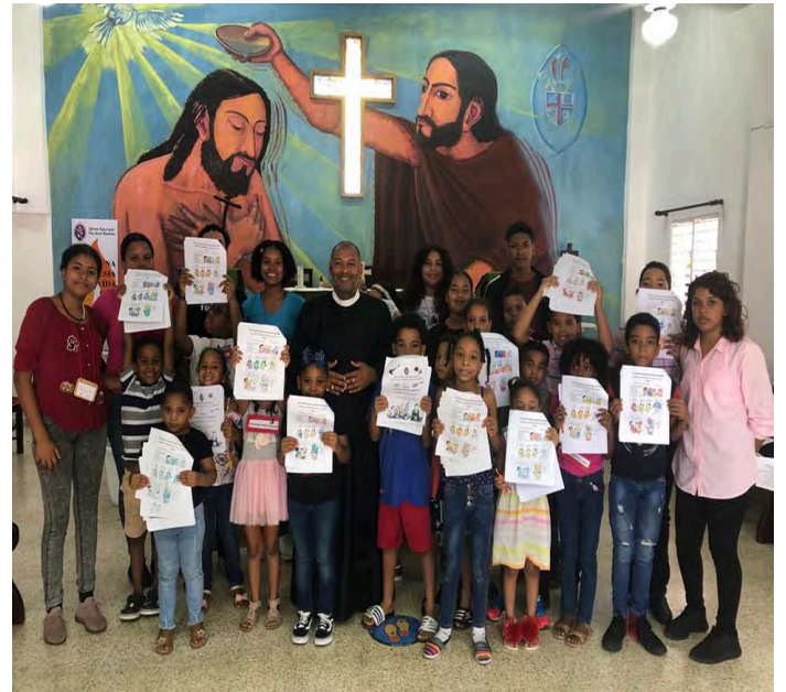
Iglesia Episcopal San Juan Bautista, Monseñor Nouel