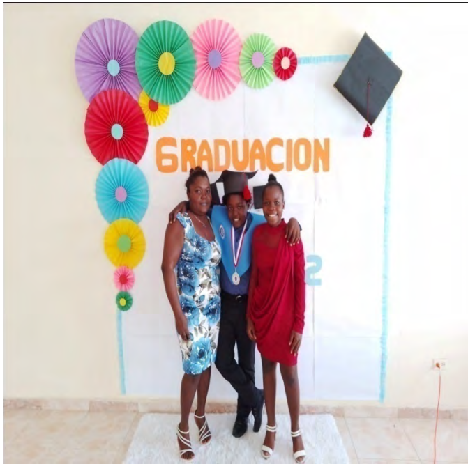
Colegio Episcopal Santa Cruz.

Promoción "ANTNG" Aquí no Termina, Nosotros Continuamos.