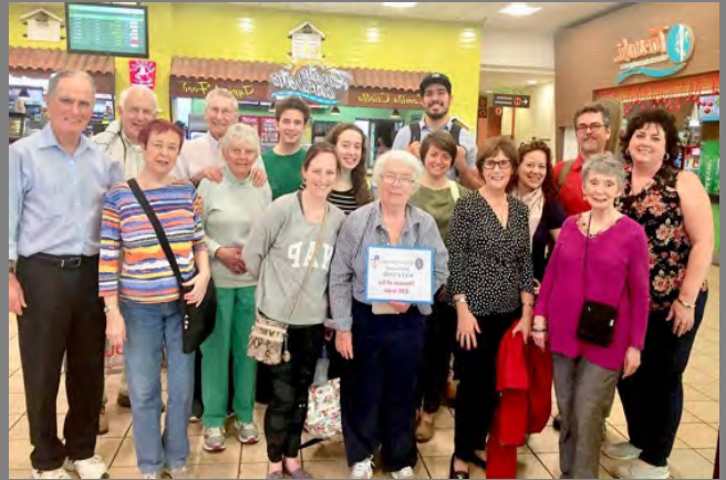
Un equipo misionero de la Diócesis de Georgia en 2019. | A mission team from the Diocese of Georgia in 2019.