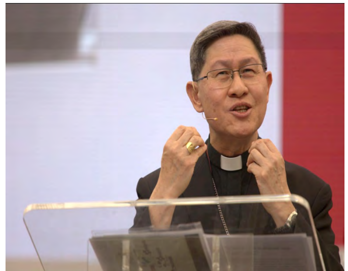
Cardenal de la Iglesia Romana, Chito Tagle.

The Cardinal of the Roman Catholic Church, Chito Tagle addressed the 2022 Lambeth Conference with a talk on the future of the Church. In a simple way and with various testimonies about his ministry among young people and also experiences with people who currently suffer for different reasons, he expressed that they are the ones who come to make up our family for our love of Christ. He stated that in a world where the future is glimpsed with so many needs and within a changing culture, the church has great challenges and we have to understand this reality and take advantage of the opportunities we have to carry out the Mission of the Church.