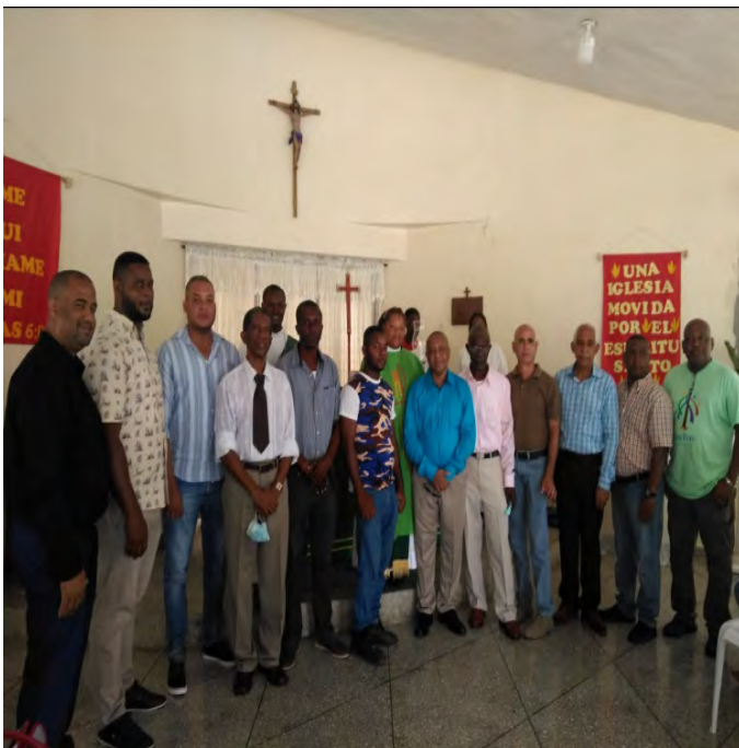
Padres de la Iglesia Episcopal San Gabriel.