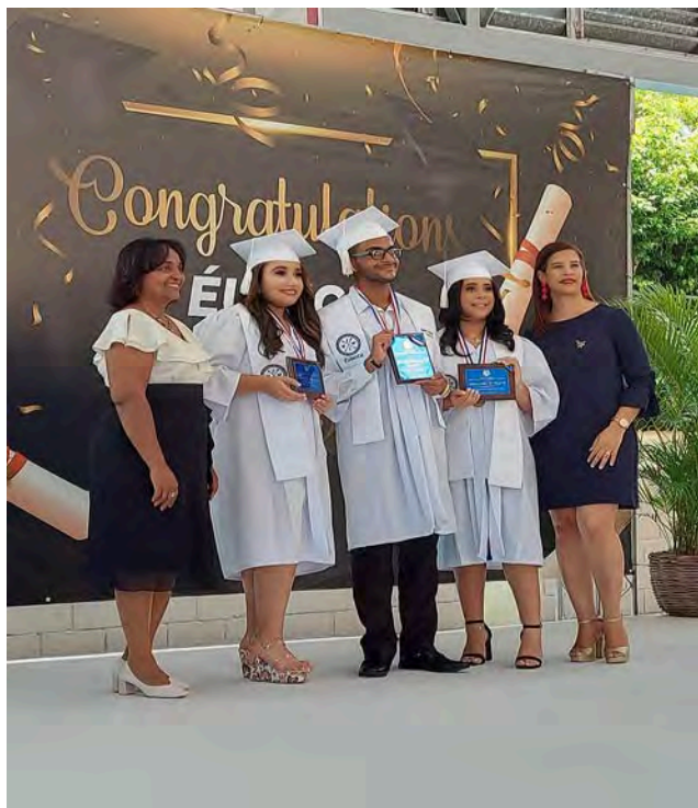
Premiación a los estudiantes meritorios y excelencia académica

El Colegio Episcopal La Anunciación, de la ciudad de Santiago de Los Caballeros, Rep. Dom. reconoce la excelencia al mérito magisterial creativo, solidario, leal y comprometido de sus docentes, personal de apoyo y administrativo, año 2021-2022. "Dios ha sido bueno".