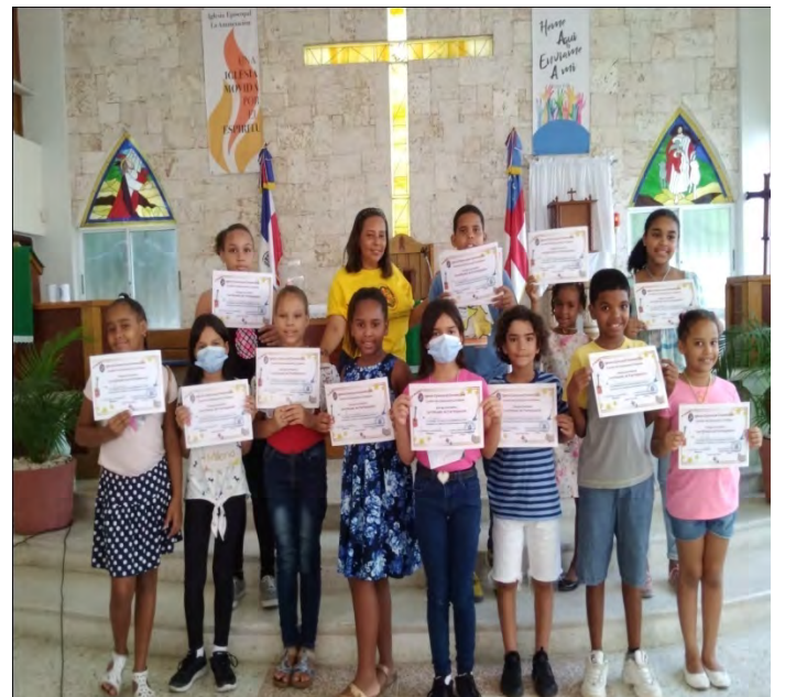
Iglesia Episcopal La Anunciación, Santiago