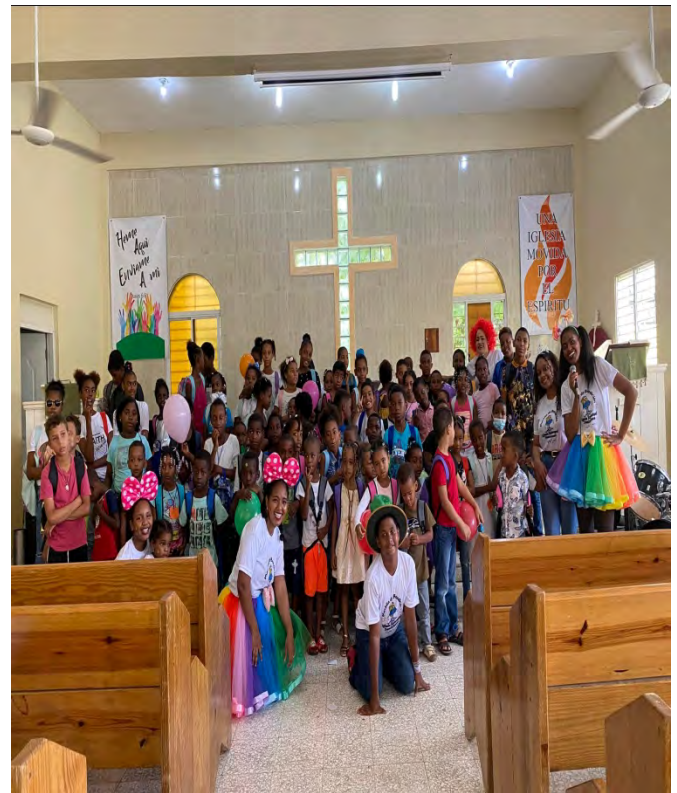
Iglesia Episcopal Santa Cruz, Santa Fe