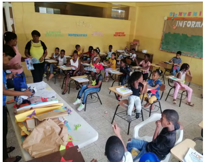
Iglesia Episcopal Santa Cruz, Ingenio Santa Fe