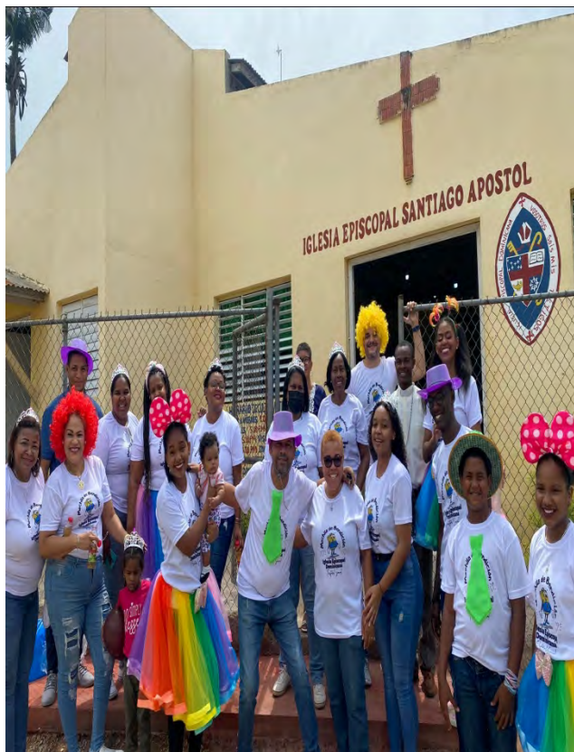
Parte del Equipo de Mochilas de Bendición en la Iglesia Episcopal Santiago Apóstol