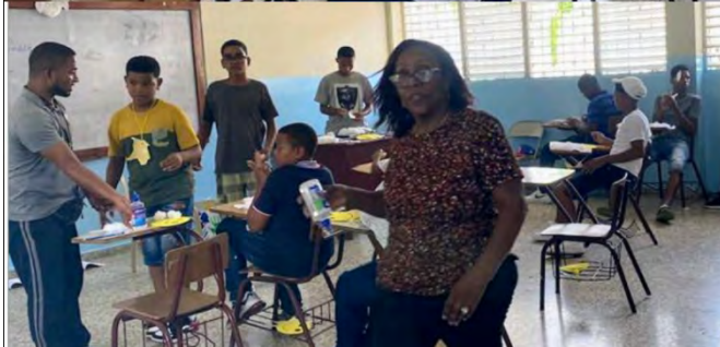
Iglesia Episcopal Todos Los Santos, La Romana