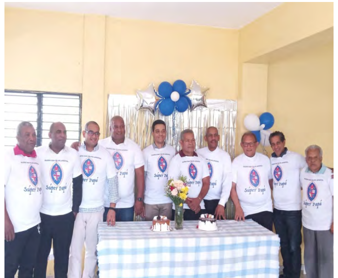
Padres de la Iglesia episcopal San Felipe Apóstol