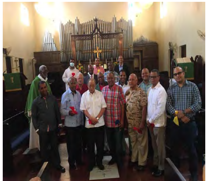
Padres de la Iglesia Catedral de la Epifanía