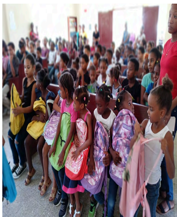
Iglesia Episcopal Espíritu Santo, Dajabón.