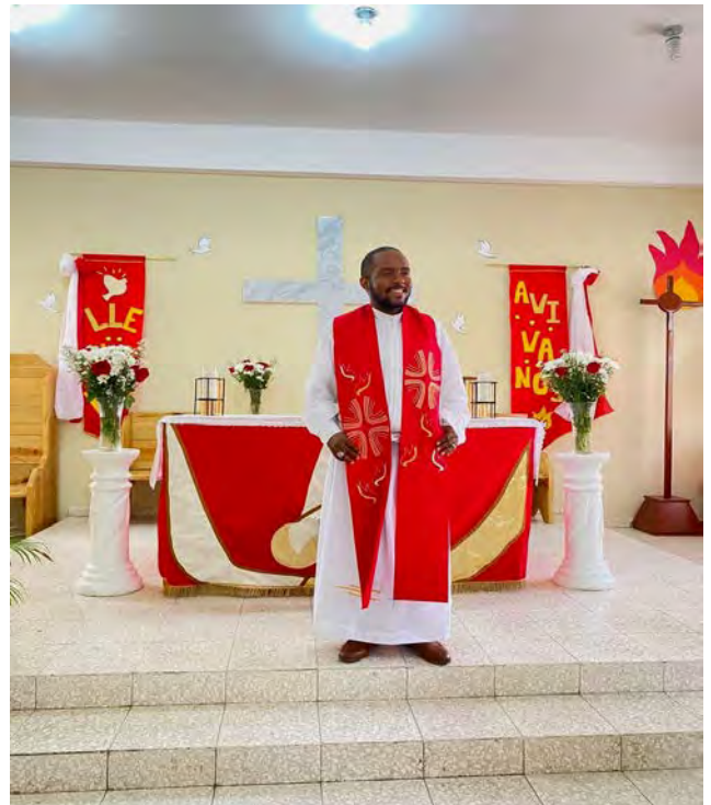
Iglesia Episcopal Mote de Sión