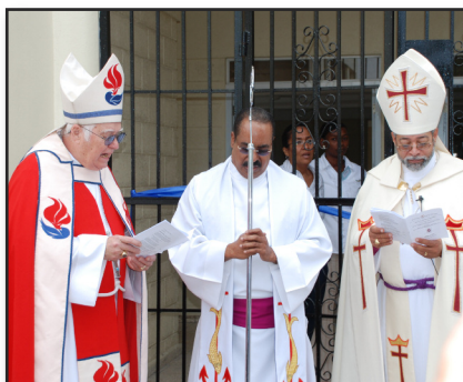
Dedication of the Bishop William Skilton Conference Center

Centro de Conferencias esta compuesta por un comedor y cocina en el primer nivel y un amplio salón de reuniones en la segunda planta. El Centro de Conferencia Obispo William J. Skilton esta al lado del Hogar de Envejecientes Obispo Isaac y frente a la Iglesia y el Colegio San José en Andrés, Boca Chica. En el futuro se construirán cabañas/dormitorios ofreciendo alojamiento para los que vengan al centro.