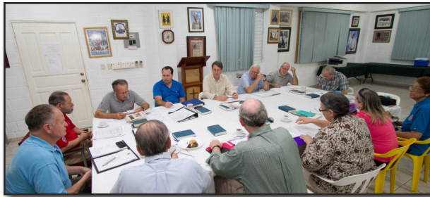
DDG Board Meeting

DDG Board Meeting. Every year after the DR Diocesan Convention the Dominican Development Group holds its annual Board Meeting. This year it was held the evening of Sunday February 12th and all day Monday February 13th. The DDG is a unique non-profit, tax-exempt organization whose sole purpose is to assist in the development and self-sufficiency of the Dominican Episcopal Church.