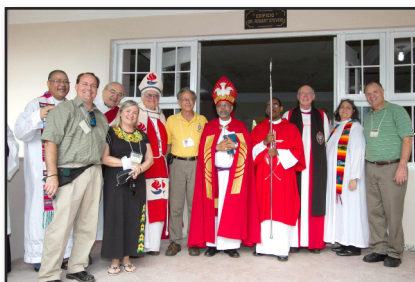
Dedication of the Dr. Robert Stevens Dormitory

Dedicaciones. Como se nota arriba, la Cabaña/Dormitorio John y Cathy Gordon de dos pisos y el Dormitorio Dr. Robert Stevens fueron dedicados y bendecidos durante la Convención Diocesana el 11 de Febrero en el Campamento y Centro de Conferencias Monte de la Transfiguración , Jarabacoa – en las montañas de la RD. En el futuro se añadirá al dormitorio principal Dr. Robert Stevens un segundo piso con habitaciones para dos o tres personas.