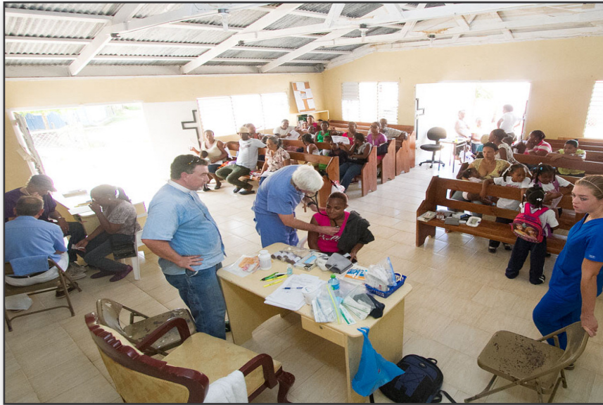
The interior of the Santiago Apostol church in Angelina with the medical clinic in progress. El interior de la Iglesia Santiago Apóstol en Angelina con el operativo médico en proceso.

Members from the Cathedral of St. Luke and St. Paul, Charleston, South Carolina, and St. Matthews, Darlington, South Carolina, have been working in the Angelina community since March of 2007. The first medical clinic was held the following spring and a significant number of patients had chronic hypertension and/or diabetes. One of the local government physicians approved of our plan to provide these patients with medicines year round, provided they are followed up locally. A small medical team visits the community every spring and in recent years a larger diocesan team has also held clinics in a separate site. We have had participation from churches in Darlington, Bluffton, Myrtle Beach, Beaufort, and several Charleston churches.