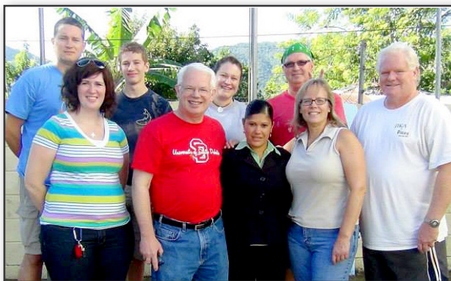
Mission Team from St. Andrew's, Omaha Nebraska