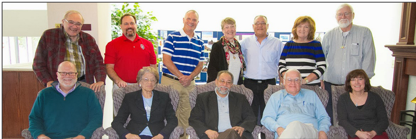
The members of the Board of Directors of the DDG in Omaha. Los miembros de la Junta Directiva del DDG en Omaha.

El Boletín del Grupo de Desarrollo Dominicano