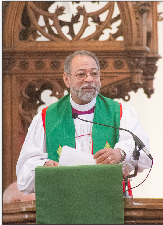
Bishop Holguín preaching at Holy Trinity Episcopal Cathedral. El Obispo Holguín predicando en la Catedral de la Santísima Trinidad.

God bless you, and keep alive the passion for mission.