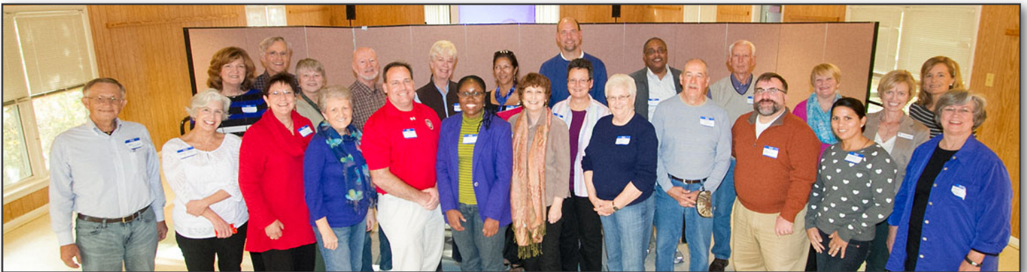
Attendees at the Diocese of East Carolina Conference. Los asistentes a la conferencia de la Diócesis de Carolina del Este.

Para ver una la versión completa de este artículo con enlaces a un conjunto más amplio de imágenes de Angelina y la historia del trabajo de este grupo misionero en la República Dominicana, ir aquí: http://dominicandevlopmentgroup.org/2013/10/27/medical-mission-team-in-angelina-and-los-conucos