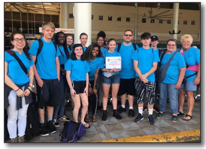
Youth Team, Diocese of Michigan