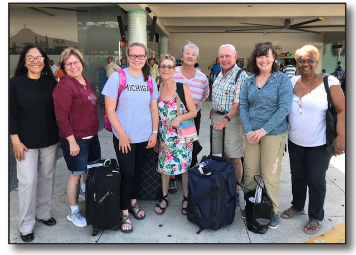
Dioceses of Eastern and Western Michigan

Mission Teams and Other Groups in May - September, 2019 Equipos de misión y otros grupos en mayo - septiembre de 2019