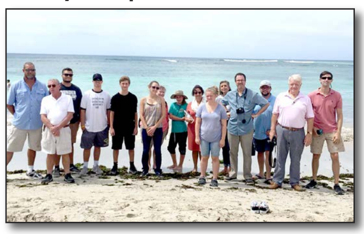
St. Paul's, Wilmongton, North Carolina