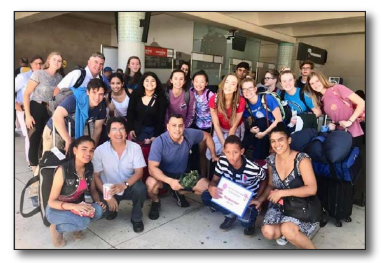
Church of the Redeemer, Sarasota, Florida