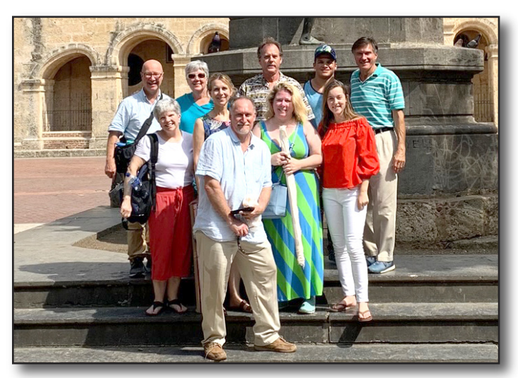
Old St. Andrews, Charleston, South Carolina