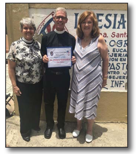
St. Peter's Cathedral, Diocese of SW Florida