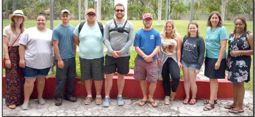
Visiting group from The Episcopal Church, New York City