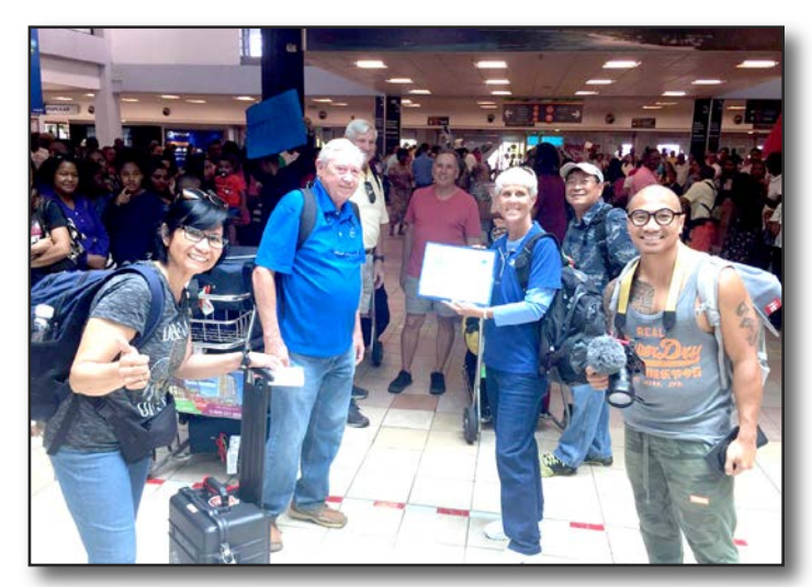
Clearwater Deanery, Diocese of SW Florida