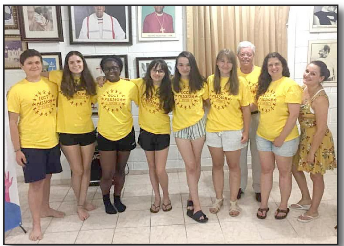
Youth Team, Diocese of Connecticut