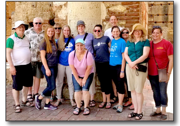
Families Team, Diocese of Nebraska