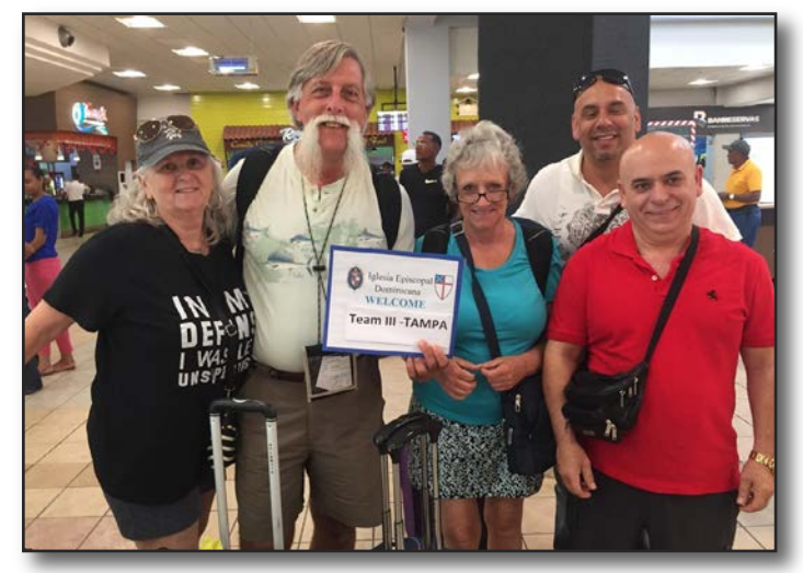
Tampa Deanery, Team III

Mission Teams and Other Groups in May - September, 2019 Equipos de misión y otros grupos en mayo - septiembre de 2019