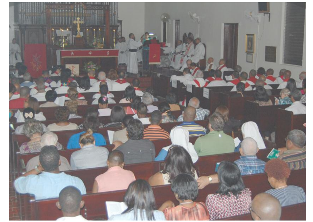
Vista amplia de la Eucaristía en la LV Convención celebra-da en la Catedral La Epifanía