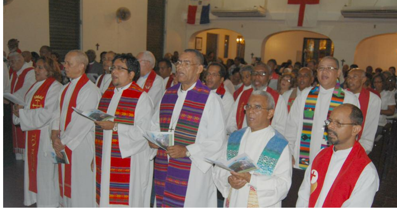
Miembros del Clero Diocesano mientras entonaban himnos en la Eucaristía