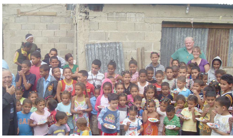
Visitando el Hogar de Niños, Visitación de Jesús en la zona Sur de Santiago, un hogar de ninos abandonados, con discapacidad que necesitan ayuda