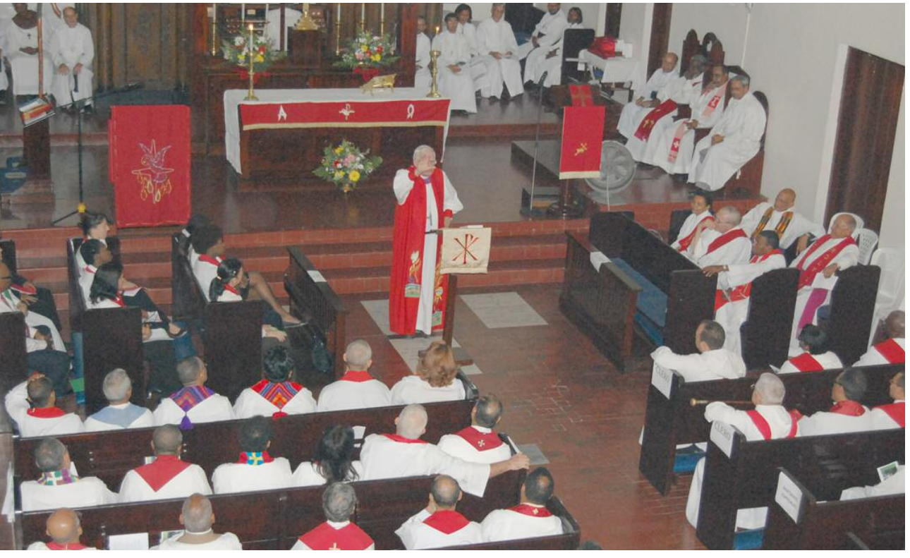
El Rdmo. Obispo William Skilton en el sermón