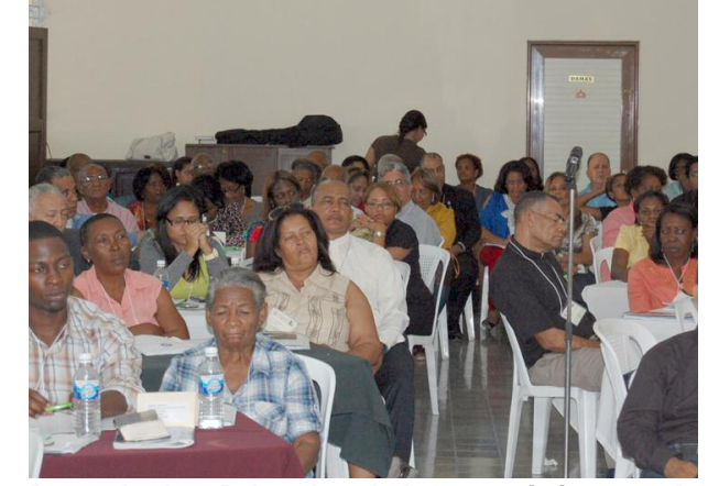
Parte de los Delegados (as) que asistieron a la Convención