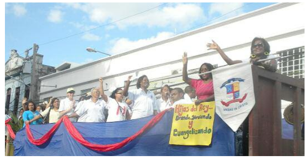
FESTIVAL CONMEMORATIVO DE LA IGLESIA EPISCOPAL DOMINICANA EN EL ARCEDIANATO ESTE

Hoy en día en la Iglesia, el Miércoles de Ceniza, el cristiano recibe una cruz en la frente con las cenizas obtenidas al quemar las palmas usadas en el Domingo de Ramos previo.