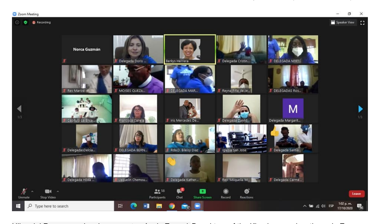
Hijas del Rey en muchos lugares a través de Zoom I Daughters of the King in many locations via Zoom

TEMA: "Tu Palabra Señor, Mensajera De Amor" (Isaías 55:11) LEMA: "Restauradas En Cristo, Para Servir Con Amor Y Esperanza" (Zacarías 9:12).