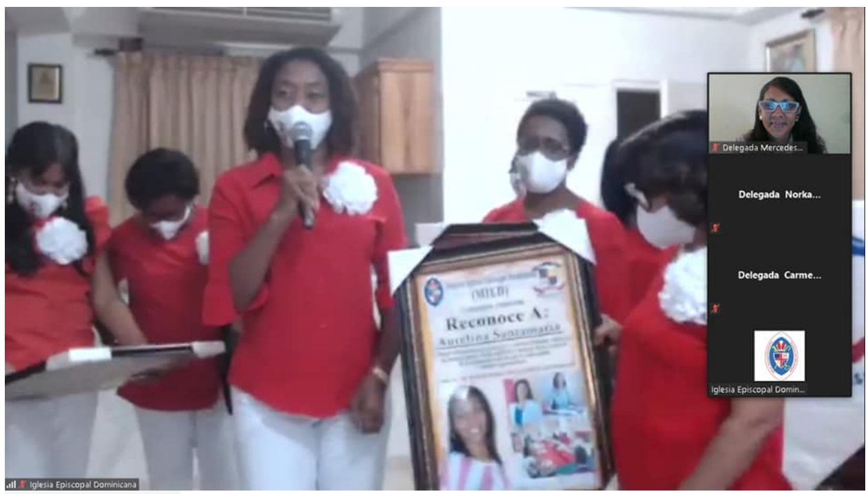
Entrega de premios I Presentation of awards