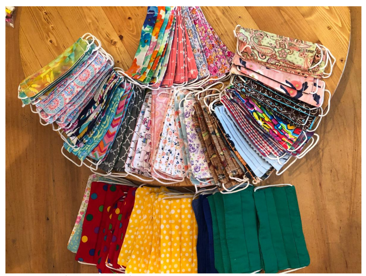
Algunas de las máscaras donadas I Some of the donated masks

The first shipment of 11,475 masks bound from Georgia to school children in the Dominican Republic arrived on Friday, July 31. They were the handiwork of mask-makers at eight churches in the Diocese of Georgia. Only a month earlier, Bishop Moisés Quezada Mota in the Dominican Republic asked for help supplying masks for the 8,000 students attending 26 Episcopal schools throughout the Dominican Republic. The response has been wonderful.