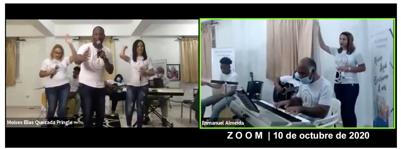
Fotografías del Ministerio Adonai durante la conferencia Zoom l Photographs of Ministerio Adonai during the Zoom conference

The Diocese of the Dominican Republic said Present! in the recent session of Nuevo Amanecer on October 10, 2020. The Nuevo Amanecer Conference is a celebration of the Latino Ministry of our Church, held biennially. Since May, several sessions have been held that have served to inform the parishioners of our Diocese..