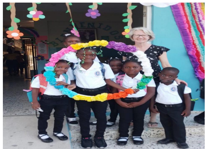
Colegio Episcopal Laura Morrow