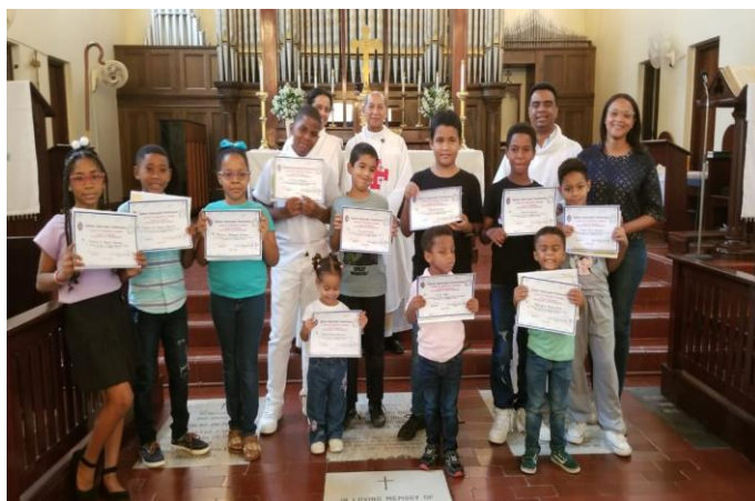
Así culmina la escuela bíblica en La Epifanía