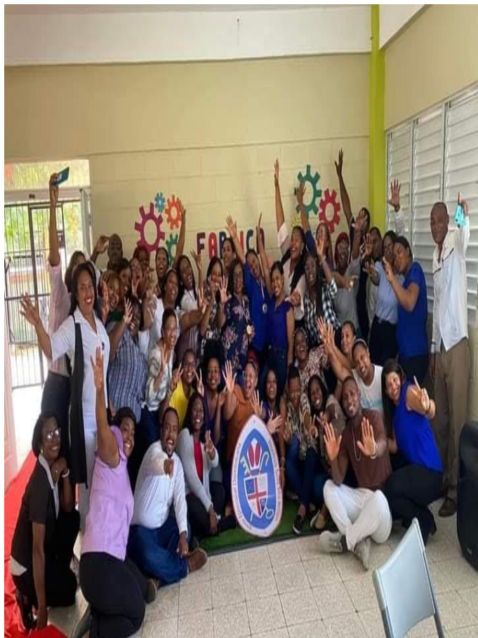
Docentes, coolaboradores y mesa directiva del Colegio Episcopal San José.