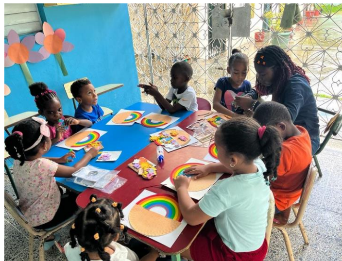
Niños de la Escuela bíblica en Santísima Trinidad elaboran juntos su manualidad.