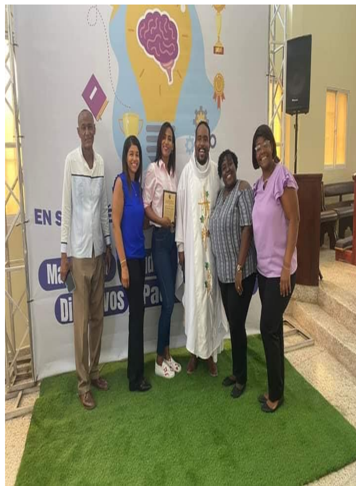
Vicario y Rector del Colegio Episcopal San José junto al equipo directivo