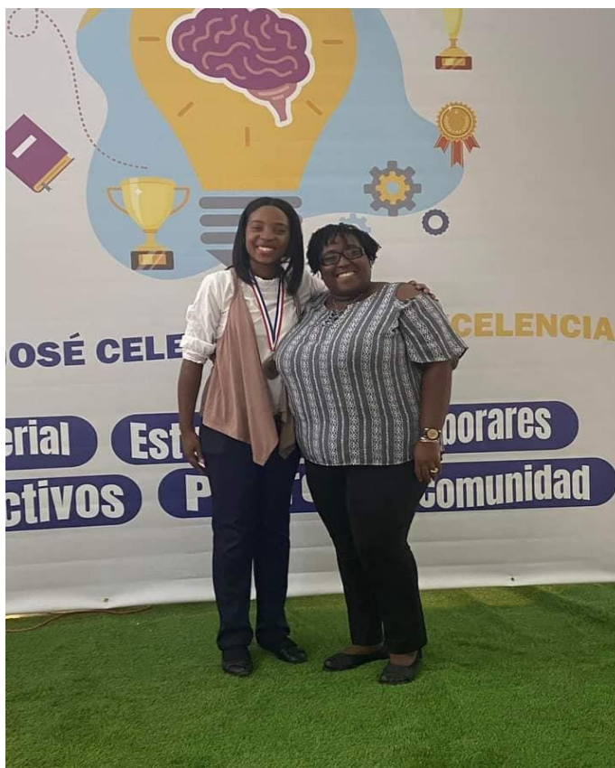
De Izquierda a Derecha: Maestra y Contable del Colegio Episcopal San José.