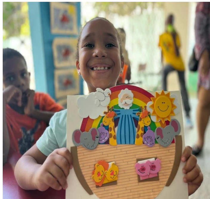
Iglesia Episcopal Santísima Trinidad.