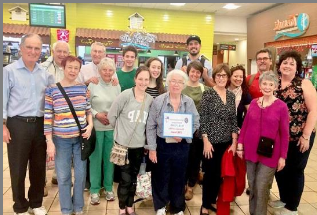
Un equipo misionero de la Diócesis de Georgia en 2019. | A mission team from the Diocese of Georgia in 2019.