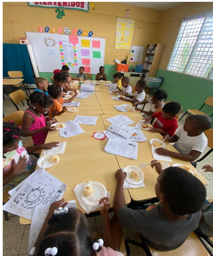
Escuela bíblica iglesia Episcopal Buen Pastor.