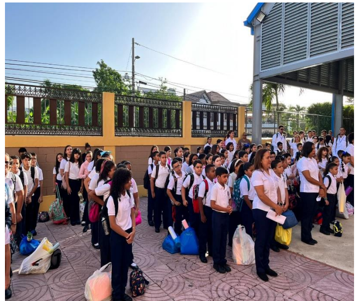
Colegio Episcopal La Anunciación.