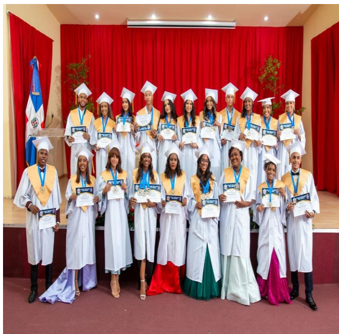
Acto de investidura de nuestros Bachilleres , promocion , Exentius 2022-2023, Colegio Episcopal San Andres.