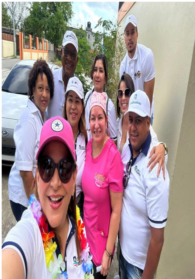
Visitantes de la Coop-Reservas