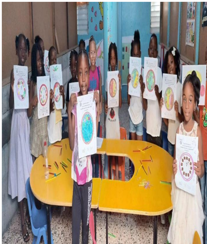
Escuela Bíblica de la Iglesia Episcopal La Redención.