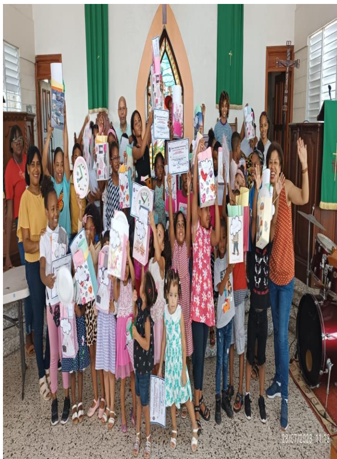
Iglesia Episcopal San Marcos.