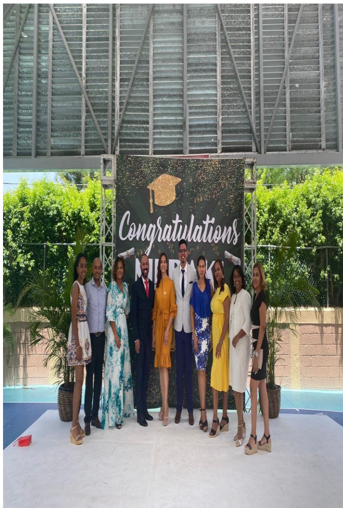
Maestros que hicieron este sueño realidad.

Colegio Episcopal San José celebrates the excellence of its teachers, collaborators and management team. With the theme: FACTORY OF LEADERS FOR THE PRESENT AND THE FUTURE , the School bets on a total reengineering for this new school year in order to get the best out of each student.