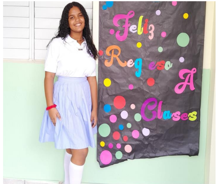
Estudiante del colegio Episcopal La Encarnación posa frente al cartel de inicio del nuevo año.