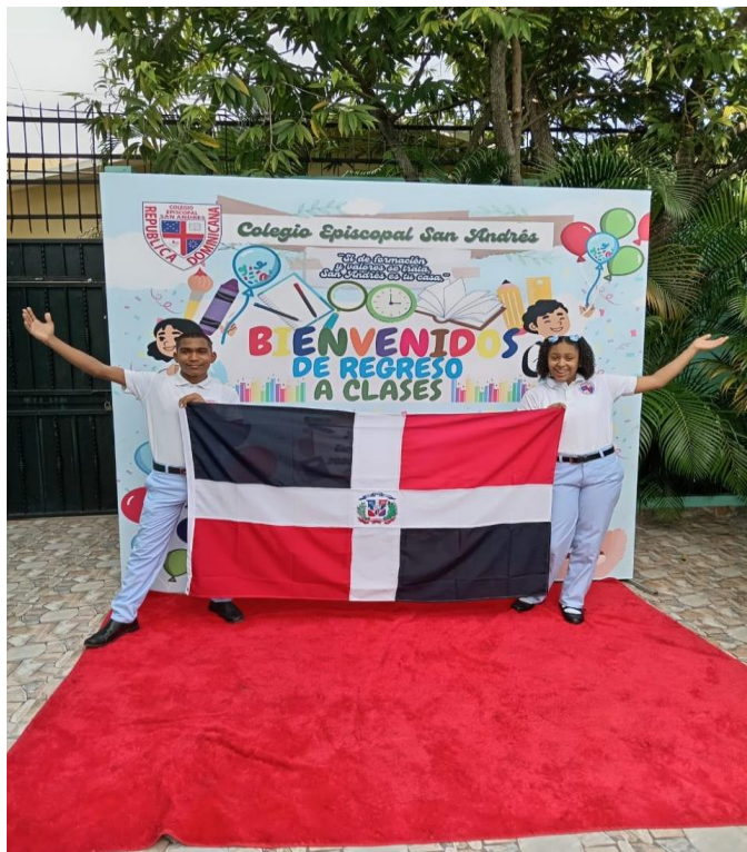
Estudiantes del Colegio Episcopal San Andrés dan la Bienvenida a clases.

As every year, the San Andres Episcopal School and other Episcopal centers start the new school year in a masterful way.