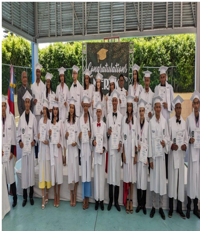
Colegio Episcopal La Anunciación.