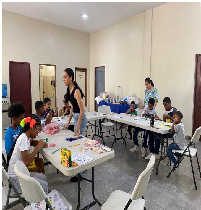
Escuela Bíblica de Iglesia Episcopal La Epifanía